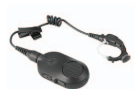
Drahtloses Zubehör für schwierige Einsätze

“Als ich die MOTOTRBO SL Reihe das erste Mal sah, dachte ich, es wäre ein Mobiltelefon. Es hat alle Fähigkeiten eines digitalen Handfunkgeräts, aber mit einem professionellen, diskreten Look, der wirklich gut zu unseren Uniformen passt.”